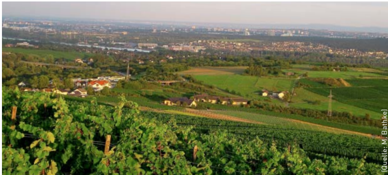
Rhein-Main-Region: Landwirtschaftliche Produktion im Ballungsraum.

zu einem Modellverbund zu verknüpfen, um deutschlandweit regionalspezifische Analysen durchzuführen, ist aus Sicht von CC-LandStraD-Koordinator Gömann eine zentrale Herausforderung. Das Ziel sei dabei klar. Gömann: »Das Projekt soll die bislang emotional geführte Diskussion, was die Landnutzung für den Klimaschutz erreichen kann, auf eine sachliche und wissenschaftliche Grundlage stellen«. Im Idealfall könnten sich damit Maßnahmen definieren lassen, denen alle Nutzergruppen problemlos zustimmen. Anwendung finden dürften die Ergebnisse