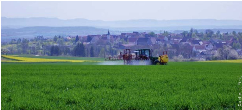
Landwirtschaftliche Bewirtschaftung im Heckengäu.