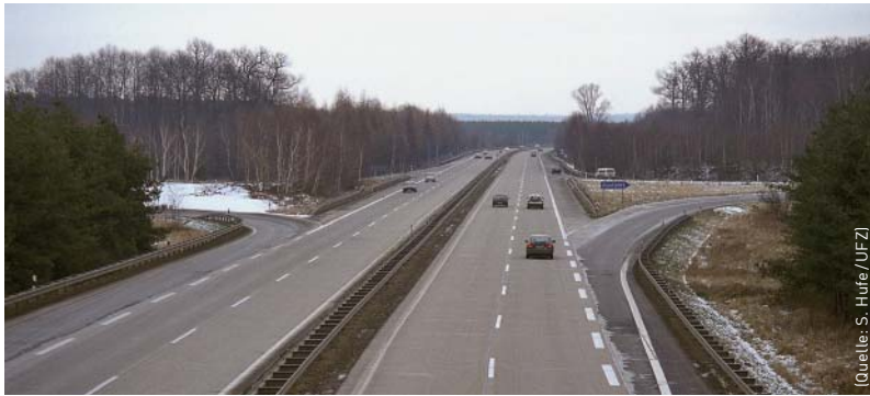
Autobahn in Deutschland. Verkehrsflächen wie diese beanspruchen immer mehr Flächen.