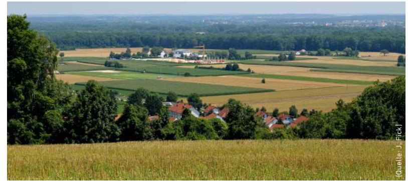
Verschiedene Flächennutzungen der Donau-niederung bei Ulm.

Denn die Flächenkonkurrenz ist hierzulande groß, seitdem die Bundesregierung mit der Energiewende landwirtschaftliche Produkte wie Mais oder Raps auch zu Energiezwecken nutzen lassen will. Das hat Folgen: So wird beispielsweise in einigen Gegenden Deutschlands unter dem Schlagwort »Vermaisung« heftig diskutiert, ob der Maisanbau für Biogasanlagen nicht die Landschaft verschandelt und dem Anbau von Nahrungsprodukten wertvolle Ackerfläche wegnimmt. Wichtig ist deshalb: »Maßnahmen, wie etwa neue Formen des Landmanagements oder