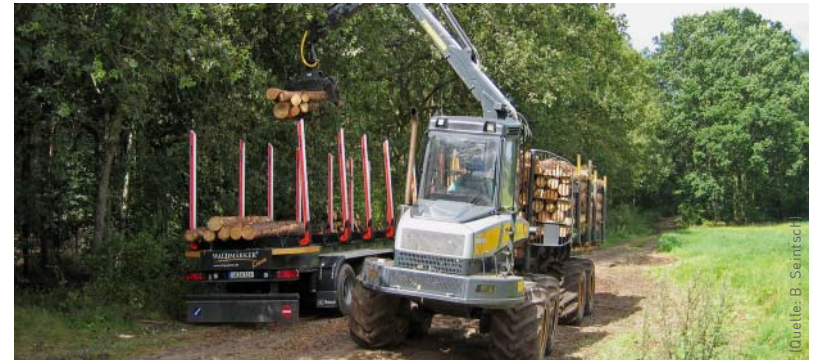
Steigende Holzpreise bewirken einer stärkere forstwirtschaftliche Nutzung der Wälder.

Die Unterschiede könnten gegensätzlicher nicht sein. Auf der einen Seite die Altmark im Osten Deutschlands: Gering bevölkert, wenig Siedlungs- und Verkehrsflächen und mehr als 60 Prozent der Fläche landwirtschaftlich genutzt. Im Westen dagegen der Rhein-Sieg-Kreis und der Rheinisch-Bergische Kreis: Eine zehnmal höhere Einwohnerdichte, deutlich mehr Siedlungs-, aber viel weniger Agrarfläche. Die vielfältige land- und forstwirtschaftliche Nutzung von Flächen in den beiden Modellregionen ist typisch für viele der rund 300 Landkreise in Deutschland, dennoch sind sie besonders und deshalb ins Visier der Wissenschaft geraten. »Wir wollen in den beiden Regionen untersuchen, wie sich Landnutzungsstrategien umsetzen lassen, um so dem Klima zu helfen«, sagt Rosemarie Siebert. Die promovierte Sozialwissenschaftlerin forscht am Leibniz-Zentrum für Agrarlandschaftsforschung (ZALF). Vom brandenburgischen Müncheberg aus trägt Siebert gemeinsam mit Wibke Crewett mit ihren Ergebnissen aus dem Teilprojekt »Regionaler Beteiligungsprozess« einen wichtigen Baustein zum Gesamtvorhaben CC-LandStraD